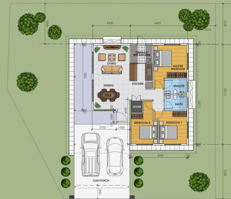
• RUMAH BANGLO SETINGKAT