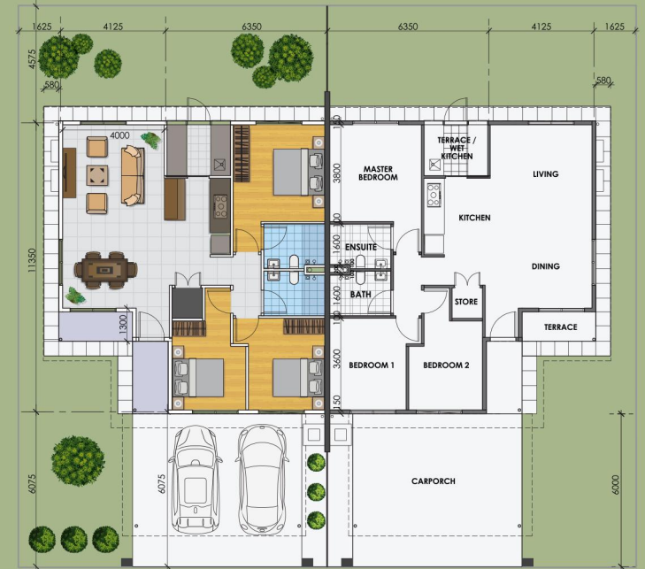
• RUMAH BERKEMBAR SETINGKAT